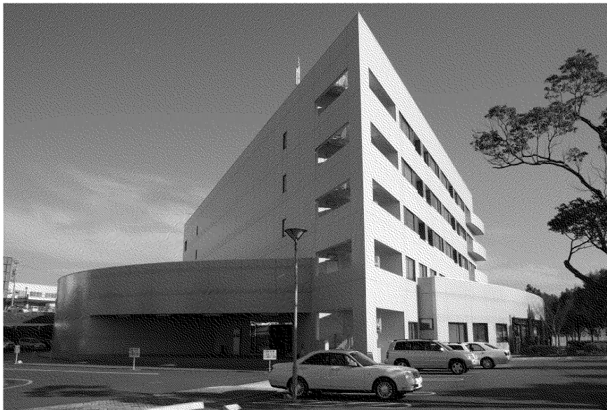
「豊橋サイエンスコア」